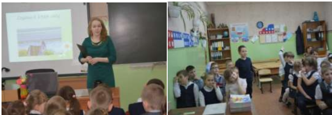
МКОУ Приобская начальная школа

Ребятам была показана презентация «Заказник «Унторский», в ходе которой дети познакомились не только с природой родного края, но и поближе узнали о работе заказника. Ученики задавали много вопросов о птицах, занесенных в Красную книгу - орлане - белохвосте, ястребиной сове и о многом другом.