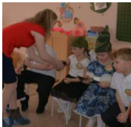
МБДОУ ДСОВ «Дюймовочка»

❖ 17.04.2017г. государственным инспектором по охране территории памятника природы «Луговские мамонты» был произведен выезд с группой посетителей на территорию памятника природы для проведения экскурсии, в ходе которой была проведена познавательная беседа. Посетители получили ответы на интересующие их вопросы. Экскурсия проходила по накатанному снегоходом следу. Также группа экскурсантов посетила место работ по захоронению мамонтов.