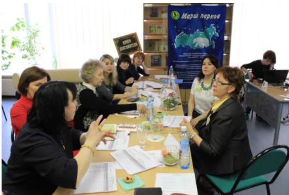
21 апреля. Торжественная церемония награждения призеров конкурса чтецов