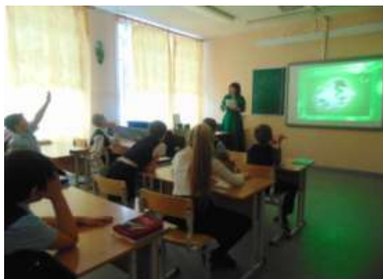
МБОУ СОШ № 3 г. Ханты-Мансийск